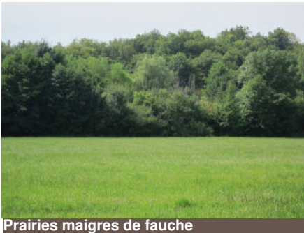
Prairies maigres de fauche

Ces habitats sont majoritairement des formations végétales à hautes herbes. Certains d'entre eux sont rares comme les tourbières basses alcalines ou les marais alcalins à Marisque, disparus de plusieurs régions et menacés dans la plupart des autres. Les prairies humides à Molinie ou les prairies maigres de fauche ont une valeur patrimoniale très forte, de par leurs richesses floristique et faunistique, comme en témoigne la présence de la remarquable Fritillaire pintade ou encore, des 4 papillons d'intérêt communautaire (cf page 14). Ces habitats sont liés aux pratiques agricoles des systèmes d'élevage extensifs (pression de pâturage limitée en saison, régime de fauche traditionnelle et tardive) et sont donc sensibles à l'intensification des pratiques ou à leur abandon.