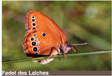
Fadet des Laïches

Aussi appelé Œdipe, ce petit papillon est intimement lié aux tourbières. Ses plantes hôtes peuvent être la Molinie bleue ou le Choin noirâtre, typiques des zones humides où elles forment d'épaisses touffes appelées touradons. Sa chenille y passe l'hiver au sec et se nourrit des feuilles.