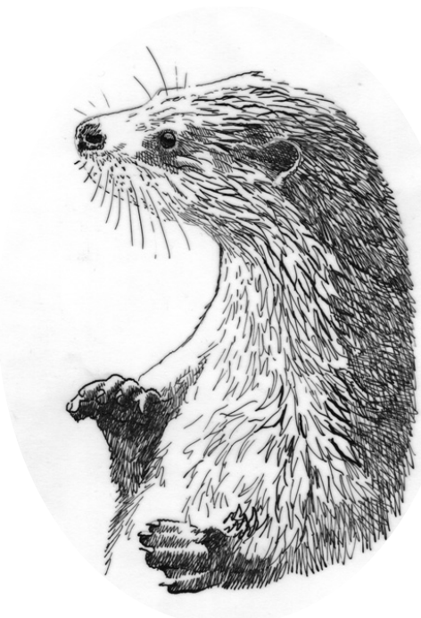
Loutre d'Europe

La Loutre est aujourd'hui en augmentation et bien présente sur le bassin de la Nizonne, après avoir été fortement en déclin jusque dans les années 1960-1990 (essentiellement à cause du piégeage).