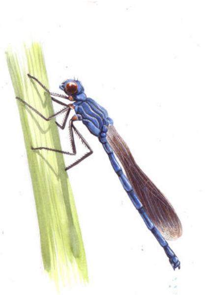
Ailes repliées de Demoiselle

Toutes trois sont protégées en France et se retrouvent à proximité des eaux claires permanentes, bien oxygénées, avec de la végétation aquatique et ensoleillée.