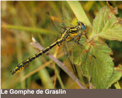
Le Gomphe de Graslin