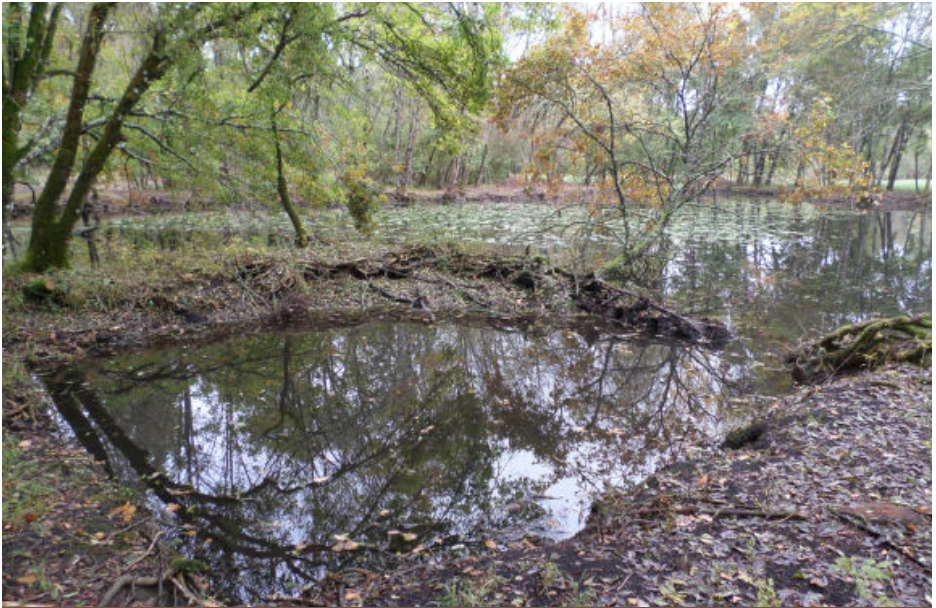
Contrat Natura 2000 des Tourbières de la Lizonne