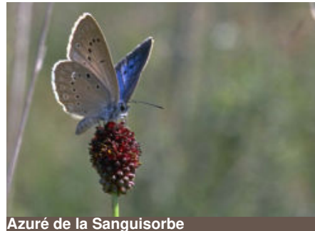
Azuré de la Sanguisorbe

On le trouve autour des tourbières de Venduire, un des seuls sites de présence de l'espèce en Aquitaine. Très vulnérable, sa reproduction bien particulière dépend de la présence de la grande sanguisorbe, sa plante hôte, et d'une fourmi du genre Myrmica . Sa chenille hiverne à l'intérieur de la fourmière, où elle passe dix à onze mois de sa vie avant de se transformer en papillon au printemps.