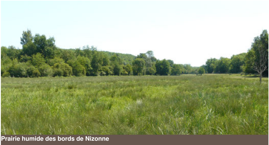
Prairie humide des bords de Nizonne

Les mesures agro-environnementales, permettent aux exploitants de s'engager pendant 5 ans à respecter des pratiques permettant de conserver les habitats en bon état (absence de fertilisation, retard de fauche après le 20 juin, absence de pâturage hivernal ou ajustement de la pression de pâturage, reconversion de terres arables en prairies, ...) en contrepartie d'une indemnisation financière annuelle compensant les manques à gagner et les surcoûts liés à ces pratiques. En 2016, ce sont près de 27 exploitations pour 314 ha qui sont en cours d'engagement soit environ 20 % de la surface agricole utile (SAU) du site qui respecte un cahier des charges MAE.