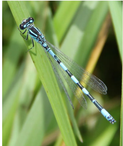
Agrion de Mercure

«Quelques tres especies de parparelas dependen de la preservacion de las zonas umidas.»