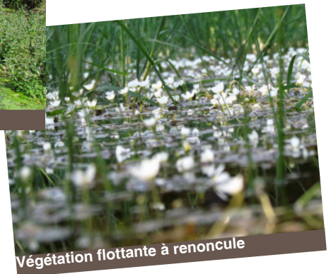
Végétation flottante à renoncule