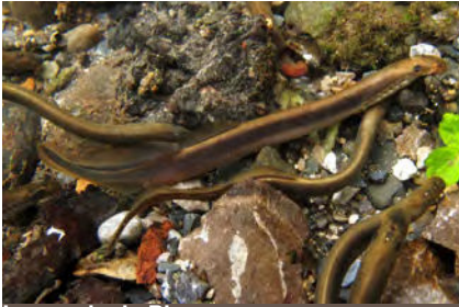
Lamproie de Planer