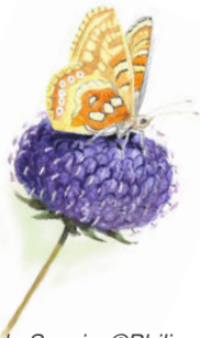
Damier de la Succise

Son cycle de développement est étroitement lié à la Succise des prés présente dans les pariries humides.