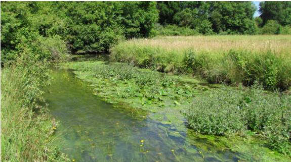
Végétation de plan d'eau

Ils jouent un rôle important comme sites d'alimentation et de reproduction pour de nombreuses espèces des milieux aquatiques (sources d'alimentation pour les espèces herbivores comme insectivores, car riches en espèces d'invertébrés et lieux de reproduction pour les libellules et certains poissons notamment). Ces milieux sont sensibles à la diminution de la transparence des eaux (turbidité liée à l'érosion des sols à nu) et à leur enrichissement en phosphates (liés aux amendements et aux rejets de stations d'épuration).