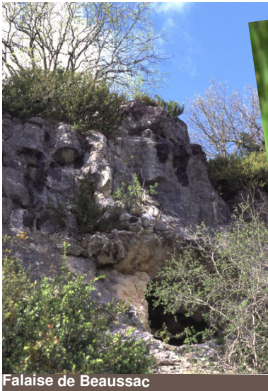
Falaise de Beaussac

*Habitats prioritaires : habitats en danger de disparition sur le territoire de l'Union Européenne qui porte une responsabilité particulière pour leur conservation.