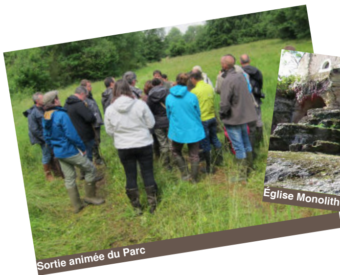
Sortie animée du Parc

Pour plus d'informations : www.guratcharente.wixsite.com