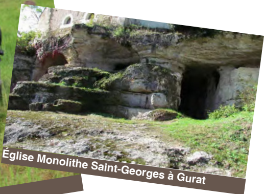
Église Monolithe Saint-Georges à Gurat