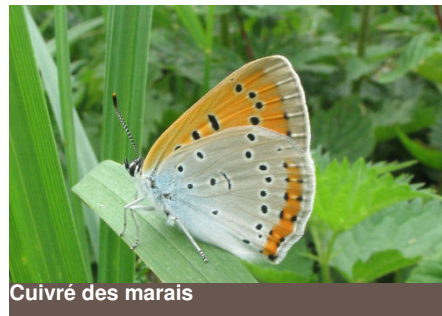
Cuivré des marais

Ses plantes hôtes sont du genre Rumex (oseille sauvage) et les adultes butinent les fleurs des plantes de «mégaphorbiaie».